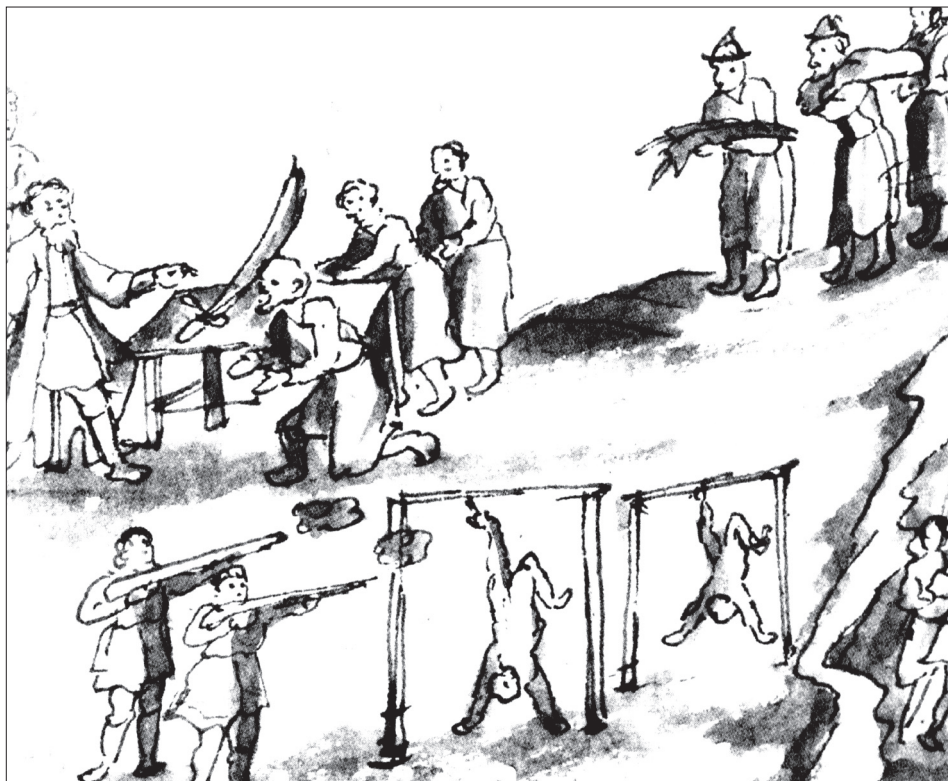
Рис. 1. Виды казней в Сибири (Миниатюра из Ремезовской летописи)

людей, которым не хотелось стать бунтовщиками и быть "вне закона". А вот по отношению к ясачным туземцам могли использоваться любые средства. Перед государем всегда можно было оправдаться их изменой.