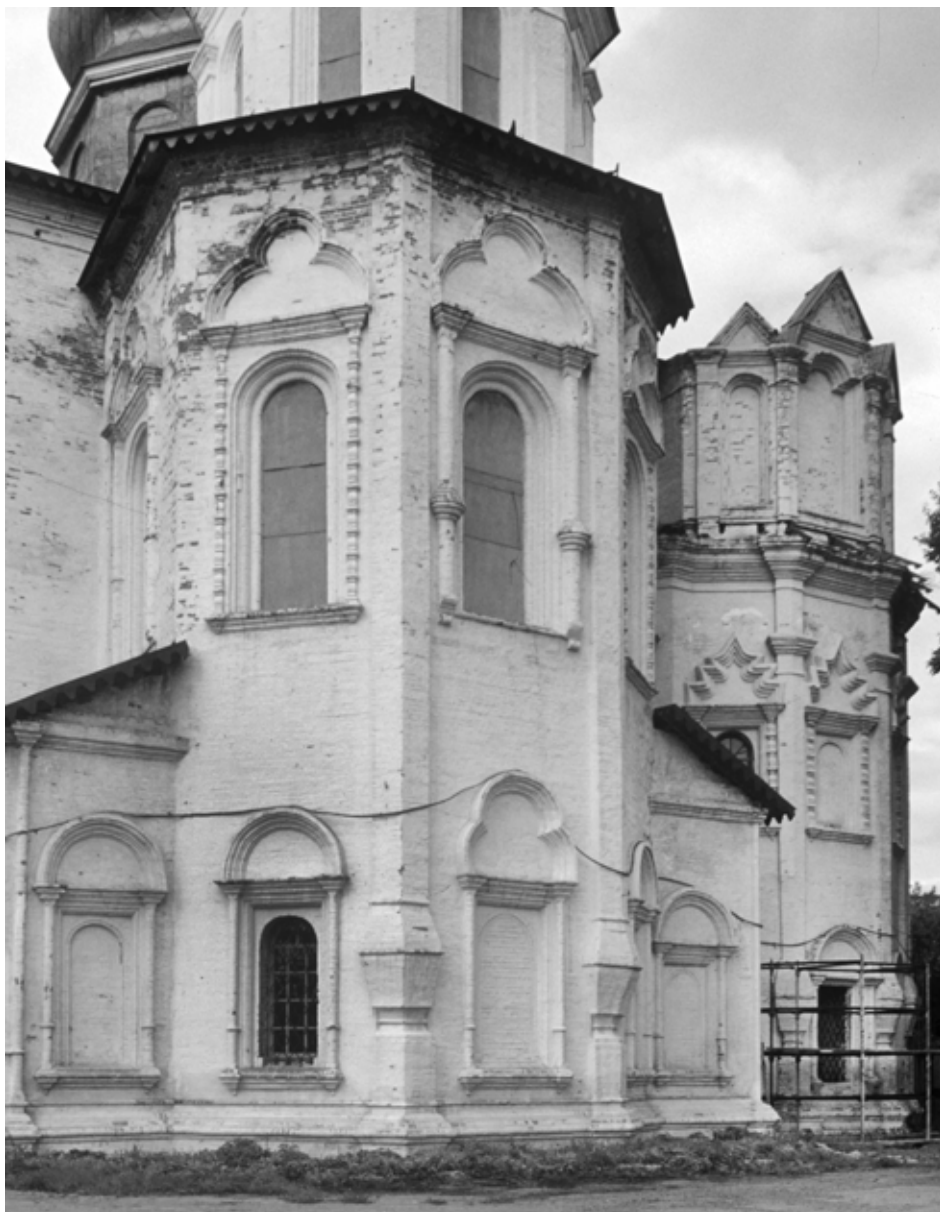
Фото 1. Тюмень. Троицкий собор, Троицкий монастырь

могли распространяться в печатной форме.