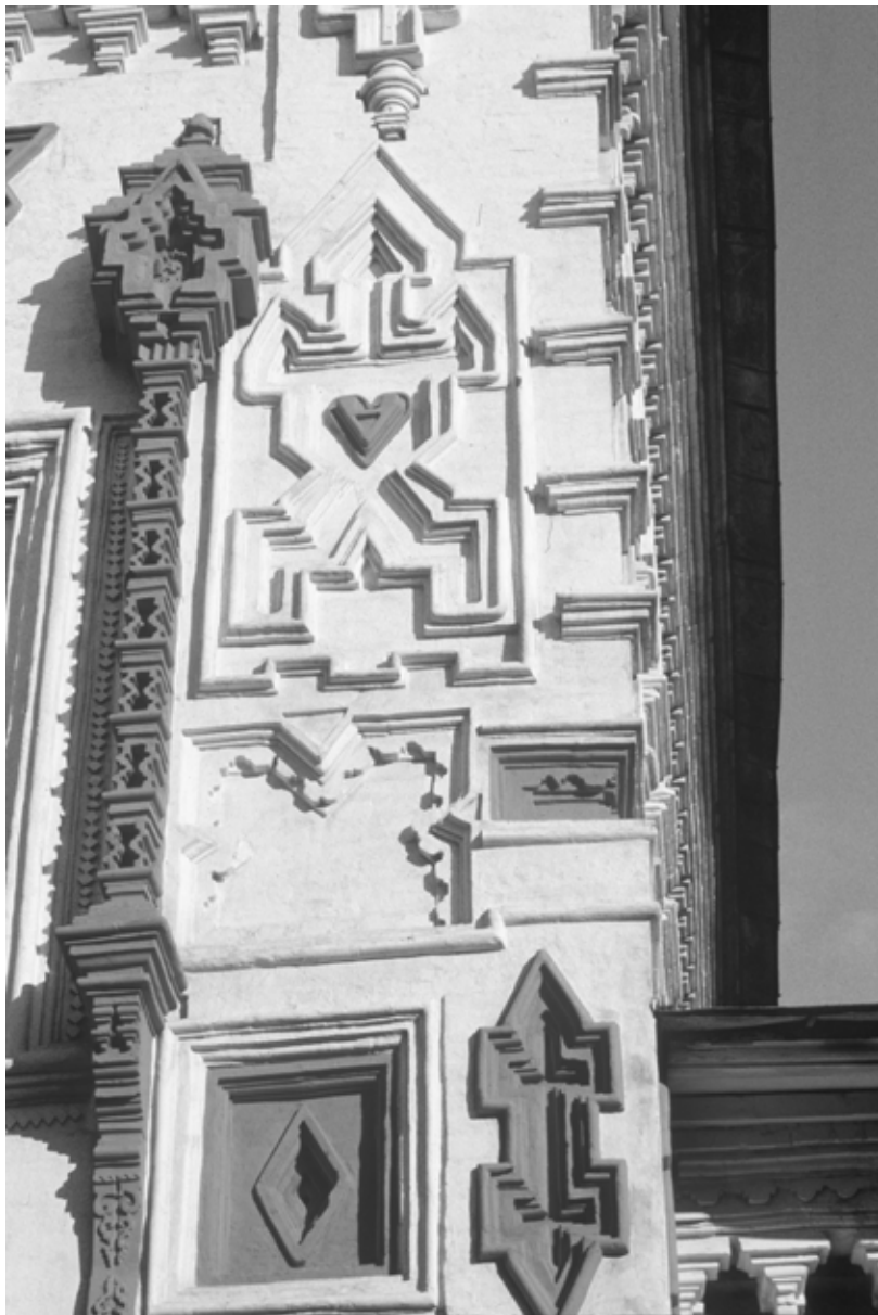
Фото 6. Иркутск. Церковь Воздвижения Креста. Деталь южного фасада.

официально отвечавшего за заселение Сибири в начале XX в., эта тема затрагивается. В инспекционной поездке по Забайкалью в 1897 году он обратил внимание на несоответствие между привлекательными буддийскими храмами и грубыми формами построенных второпях русских бревенчатых церквей. Это говорит о том, что русские уже давно заметили существование буддийских храмов на востоке России. [47, с. 33-34]