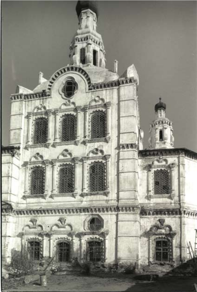
Рис. 7. Улан-Удэ. Собор Образа Одигитрии. Южный фасад

щий компонент Спасской церкви в Иркутске появился почти через полвека, после сооружения колокольни на западной стороне трапезы в 1758 – 1762 гг. Ее массивная восьмиугольная форма, которая, литературно выражаясь, «затмевает» остальную церковь, поднимается с кубического основания, где также расположены два алтаря.