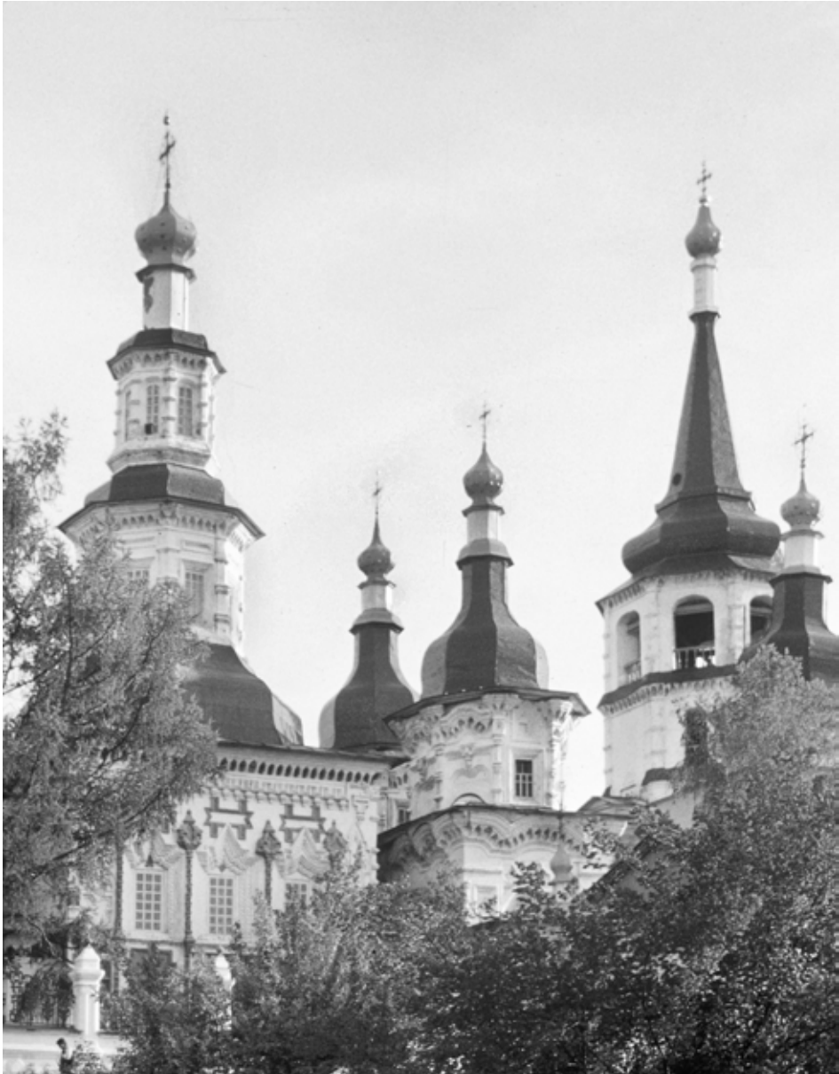
Фото 4. Иркутск. Церковь Воздвижения Креста. Северный фасад.

строительства в Сибири. Например, одно из самых старых исторических сооружений Тобольска Спасская церковь, построенная к северу от кремля в 1709 – 1713 гг., и схожая в некоторых деталях ее современница – Спасская церковь в Иркутске. [12, с. 136-137; 13, с. 152-153] По форме и орнаменту она представляет собою комбинацию московской архитектуры XVII века (геометрически неопределенный наземный план, тяжелая, но визуально впечатляющая кирпичная кладка) и «пламенеющих» (flamboyant) декоративных мотивов.