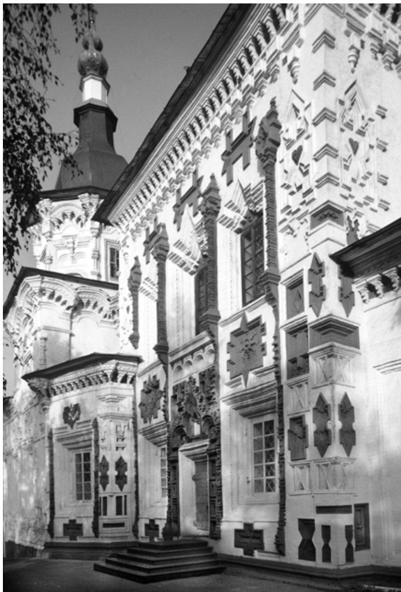
Фото 5. Иркутск. Церковь Воздвижения Креста. Южный фасад.

встречается в северо-восточном приделе церкви Троицы в Тюмени (фото 1), построенной в то же время. Хотя здесь еще нет явного проявления этого мотива, основные черты напоминают конусообразную вертикальную форму ступы (субургана) в буддийской архитектуре Юго-Восточной Азии, включая Монголию. Можно даже заметить языки пламени, которые часто окружают голову Будды. [46, с. 166]