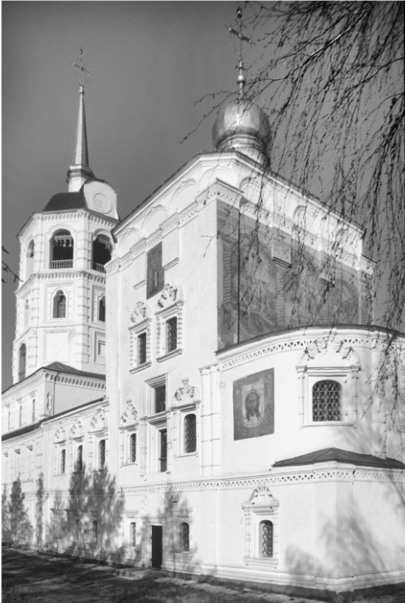
Фото 2. Иркутск. Церковь Образа Спасителя (Спаса Нерукотворного). Юго-восточная сторона.

произведением буддийского искусства. В других примерах, как в случае комплексных круто поднимающихся оконных фронтонов, возможность азиатского происхождения основывается на формальном сходстве с формой ступы. Конечно, происхождение некоторых из этих декоративных фигур может интерпретироваться по-разному, и были примеры ступенчатых завершений окон в русской архитектуре XVII века, например, церковь Двенадцати Апостолов в Московском Кремле. Однако сибирские примеры оконных завершений отличаются своеобразными остроконечными «пламенами»-завершениями. Решающий фактор здесь, на наш взгляд, содержится именно в таксономических деталях. [42, с. 184-193; 50, с. 21-30; 49, с. 21-30; 51, с. 389-392, 402, 405-407]. Более того,