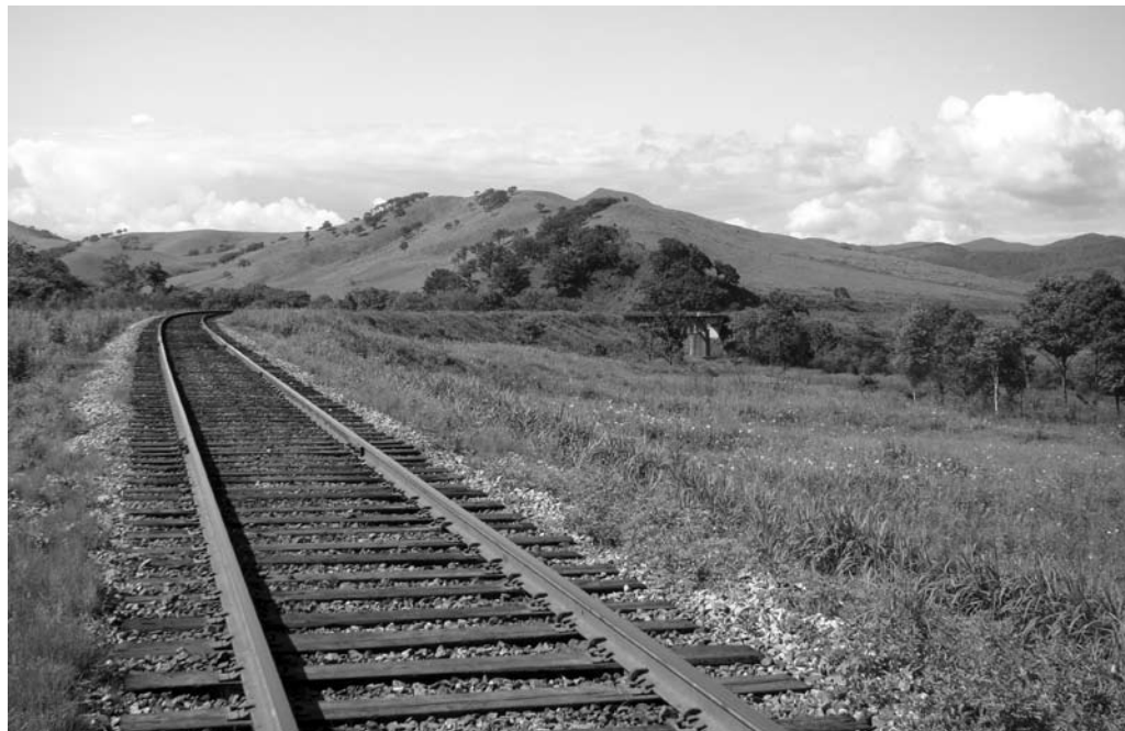
Фото 1. Текущее состояние железной дороги Уссурийск – Хасан

гия. Ничего своего нет. Простые ресурсы позарез нужны. Китайцы, им очень много надо, но они организовались по всему миру. Крупнейшие – их компании, которые сейчас везде работают. В конце концов, лишние 15-20 млн тонн нефти при потреблении в 400, не являются такими критичными. <...> Японский бизнес очень долго раскачивался. Потом, к сожалению, за 90-ые годы у японцев сложился стереотип, что Россия слабая, а мы такие сильные, и прочее».