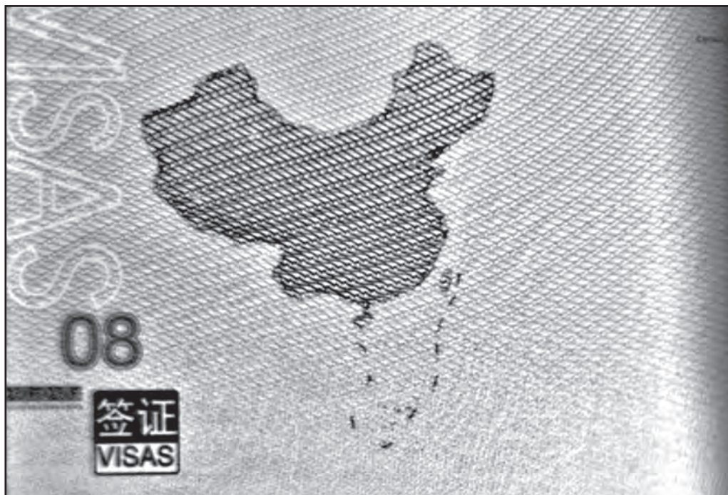
Рис. 3. Страница загранпаспорта китайских граждан нового образца

В начале 2002 г., признав Южно-китайское море очагом нестабильности в АТР, Китай и АСЕАН подписали Декларацию поведения сторон в Южно-китайском море (англ. – The Declaration on the Conduct of Parties in the South-China Sea, кит. – 南海各方行为宣言) для регулирования политики стран в отношении островов в ЮКМ, претендующих на спорные территории. В дальнейшем одним из пунктов Декларации предусматривалась выработка Кодекса поведения сторон в Южно-китайском море (англ. – Code of conduct in the South China Sea, кит. – 制定南海行为准则) [11]. Но до сих пор по различным недоговорённостям заинтересованных сторон этого сделано не было.