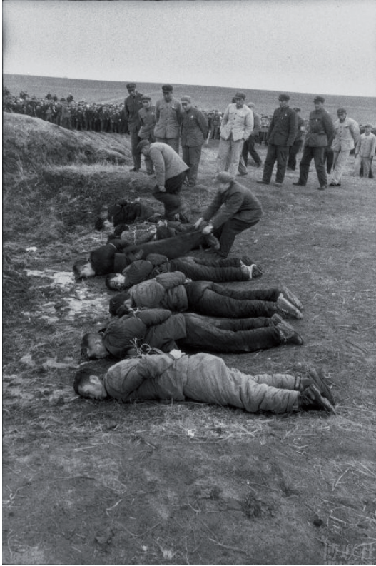
Казнь обвиненных в сочувствии "советскому ревизионизму". г. Харбин, 1968 г. Эпизод 4.

(4) Для граждан обеих стран информация асимметрична. Китай и Россия имеют разные социальные режимы, поэтому российские СМИ могут свободно и открыто публиковать различные замечания о Китае, такие как «китайская угроза», «жёлтая опасность», в таком случае у русских легко создаётся не очень положительный имидж Китая. А в Китае СМИ строго подконтрольны правительству, то есть существует только один голос по требованию властей: китайско-русские отношения стратегического партнёрства непрерывно развиваются в очень доброжелательном и очень гармоничном виде, народы двух стран уважают и любят друг друга... Такая информация является односторонней, поэтому китайцы не знают реальную ситуацию в России и подход российских СМИ к Китаю.