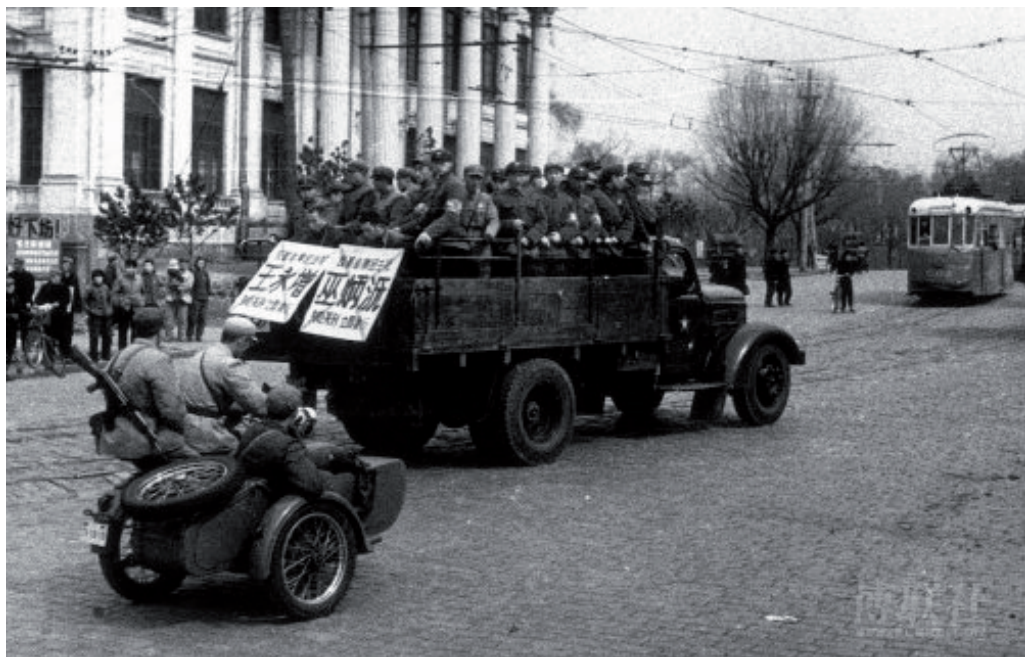
Казнь обвиненных в сочувствии "советскому ревизионизму". г. Харбин, 1968 г. Эпизод 1.

Ху Хянсу – китайский ботаник, педагог, один из основателей современной биологии Китая. В своей книге он выразил сомнение в теории Лысенко, и вместе с другом известном биологом Тан Джаджэн выступил за развитие генетической доктрины Менделя-Моргана. Китайские чиновники критиковали его, и характеризовали его подход как «антисоветский», «антикоммунистический», говорили, что он проповедовал