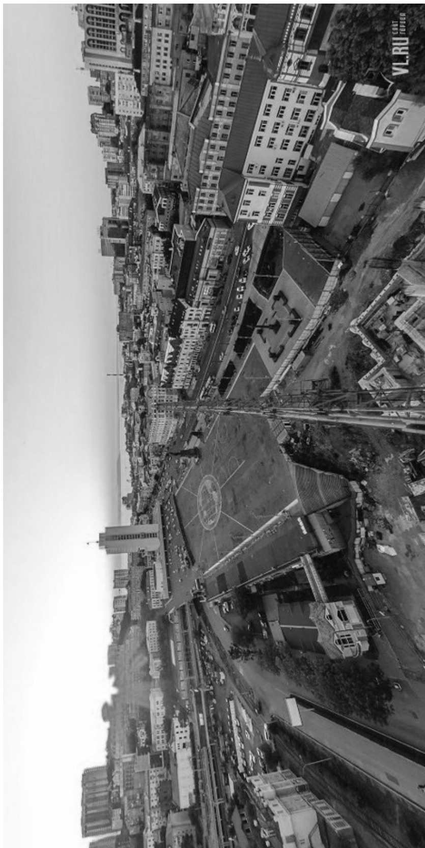
Фото 2. Панорама центральной части Владивостока в наши дни