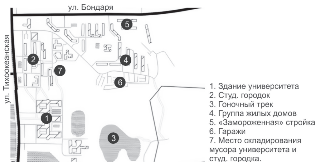
Рис. 3. Схема изучаемой локальности в мкр. Северный, г. Хабаровск.

Во всех проведенных здесь интервью ключевым мотивом было опасение потерять земельный участок. Маркером такого опасения стал вопрос "вы чиновники, али журналисты?". Интервью позволяют заключить, что главный страх местных жителей заключается в том, что местная администрация отберет их обжитые земельные участки и лишат их доступа к "свежим местным овощам".