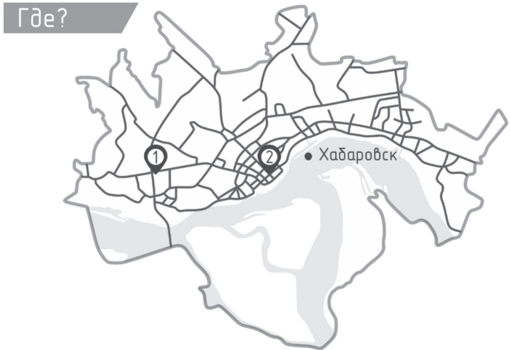
Рис. 1. Локализация исследуемых "неизвестных" сообществ.

сообществах, наиболее изученных нами к этому моменту, хотя можно предполагать наличие и других подобных сообществ.