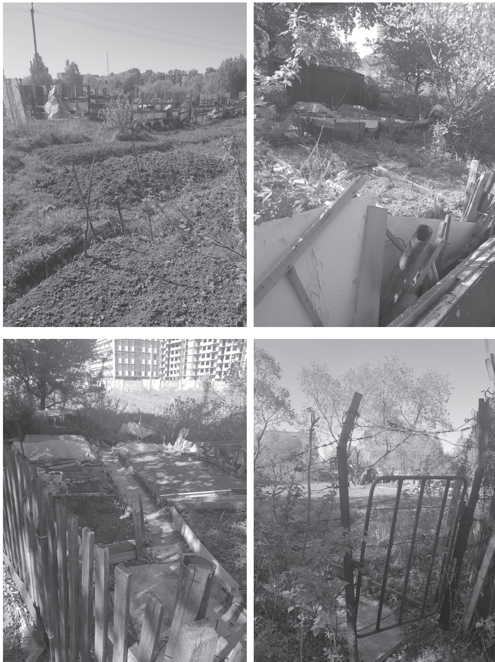
Рис 4. Организованные дачи вокруг группы жилых домов.

"маргинальной субкультуры". В трех интервью с молодыми представителями сообщества указывалось, что большинство местных работает неофициально или имеют кустарное производство (самогон, ремонт техники и т.д.) и совсем не хочет устраиваться официально и работать "на государство".