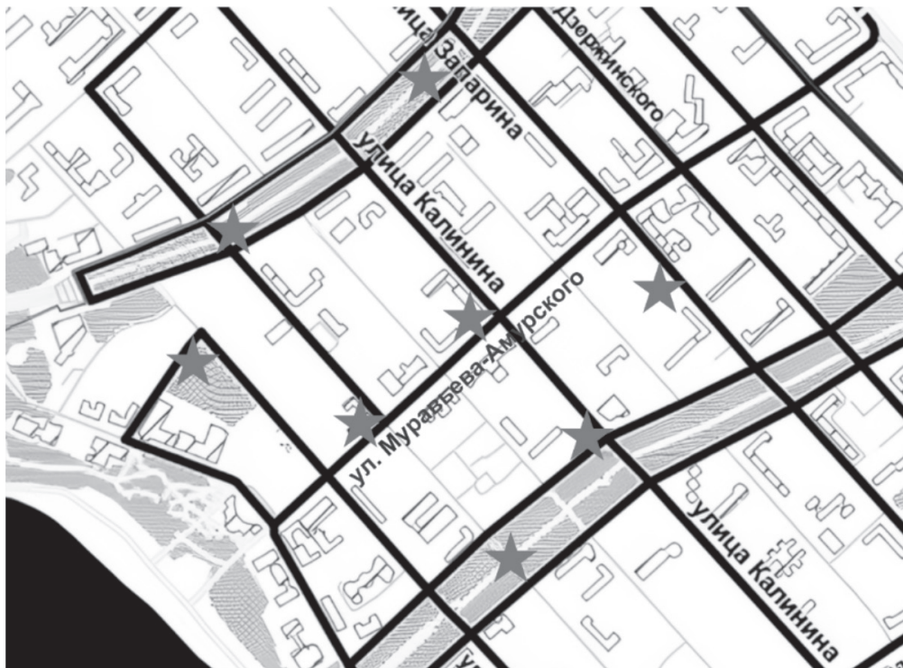
Рис. 5. Места встреч с представителями "городских собирателей".

В отличие же от группы "земледельцев", "собиратели" активнее и проще выходили на контакт и стремились больше рассказывать. Наша роль "исследователя из университета" считывалась как фактор доверия, поэтому в части интервью респонденты делились довольно личными моментами и особенно-стями организации быта и досуга в городе.