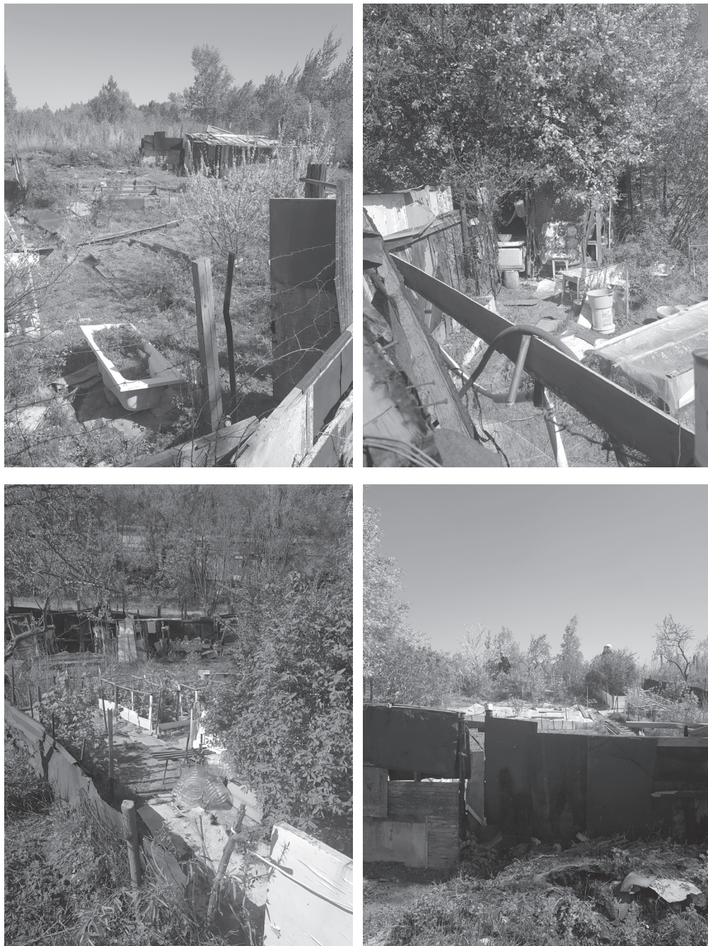
Рис. 2. Огороды "городских земледельцев"