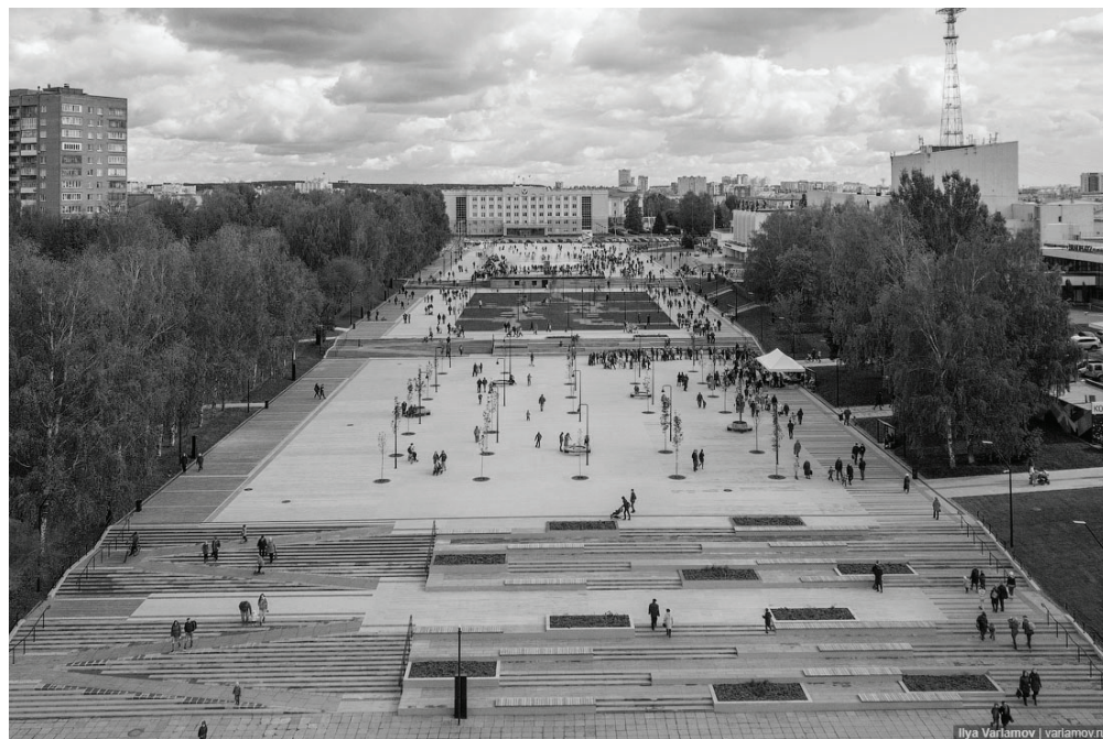
Фото 3. Центральная площадь, 2019 год.

ется. К этой категории относятся информанты, работающие в региональных и муниципальных органах власти, а также в некоммерческих организациях, связанных с проектами благоустройства городской среды. Реконструированные (Центральная площадь (фото 3)) или вновь созданные (Сквер оружейника Драгунова (фото 4)) общественные пространства действительно быстро "обрастают" кафе, лавками и магазинчиками. Пространство "Открытый сад" (фото 5) было создано как девелоперский проект для дальнейшей застройки группы компаний "Острова". В последние годы в частную собственность были переданы знаковые для ижевчан здания, которые новые владельцы реконструировали. Так, в 2018–2020 гг. здание бывшего Индустриального техникума стало гостиницей, а здание бывшего кинотеатра "Дружба" – офисным центром (фото 6). Оба здания построены в 1950-е гг. и не относились к объектам историко-культурного наследия. Информанты-чиновники подчеркивали, что при всех сложностях, сопровождающих реконструкцию и перепрофилирование этих зданий, опыт можно оценивать как позитивный. Те же информанты возлагали надежды на перспективу появления инвесторов из других регионов, высказывая убеждение, что конкуренция в среде столичного предпринимательства сделает привлекательными инвестиционные проекты в провинции: