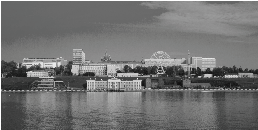
Фото 2. Вид с Ижевского пруда на набережную.