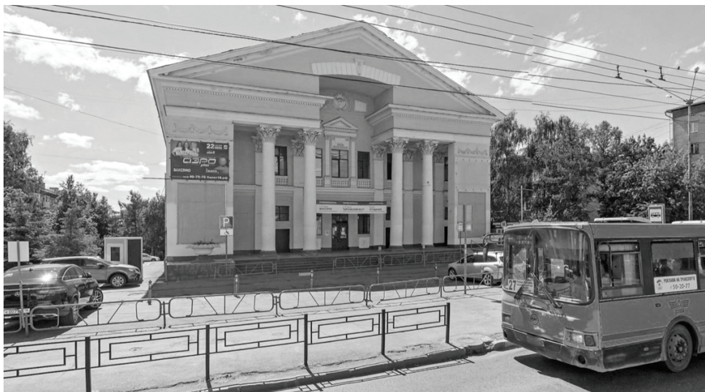
Фото 6. Здание бывшего кинотеатра "Дружба", ныне офисный центр.

ности. Некоторые информанты-бизнесмены сообщали о том, что они помогали театру по причине личной заинтересованности, то есть "по дружбе" . Система давно сложившихся личных связей чаще всего используется участниками исследования при поиске финансирования и считается самой результативной. Хотя в условиях кризиса объем ресурсов, которыми может поделиться бизнес, уменьшается: "У меня много друзей. Я могу прийти попросить, но всё реже и реже дают" (муж., художник). С другой стороны, в сети сплоченных личных связей сложно реализовать проекты, которые приходят извне, даже если они проработаны и имеют детальные обоснования.