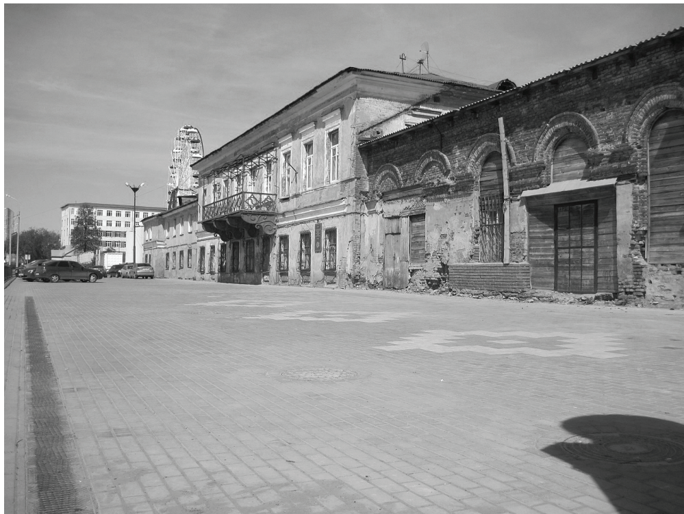
Фото 7. Здание Генеральского дома, в пристрое размещен независимый театр Les Partisans.

ологические концепты порождают обобщенные категории для разных групп населения. Благодаря мифологизированному дискурсу городские практики артикулируются и служат для идентификации горожан. Использование мифологем приобретает особый смысл, когда необходимо достичь сотрудничества между различными акторами в условиях децентрализации современной европейской политики. Позитивный пример эффективного сотрудничества городских властей и местных сообществ был реализован во французском Нанте. Стратегия управления в Нанте строилась на предоставлении дополнительных ресурсов частным девелоперам, работавшим в сотрудничестве с общественными деятелями, чтобы способствовать большей "гибкости" институциональных рамок [14, с. 97]. В то же время в идеологическом дискурсе были уязвимые места, появлялись соперничающие дискурсы оппозиционных политических сил. Публичные обсуждения воспринимались как техника манипулирования общественным мнением.