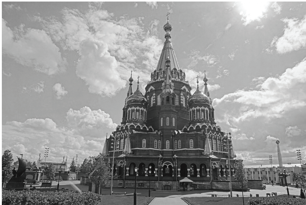
Фото 1. Свято-Михайловский собор, 2018 г.

туризма и развитие крупного бизнеса. Например, в Санкт-Петербурге после сноса старой застройки появляются коммерческие объекты, чаще всего торговые центры. Там, где сосредоточены признаваемые исторические и архитектурные ценности, бизнесу и власти особенно легко скооперироваться. Часто союзы основаны на неформальных связях, как дружеских, так и родственных. [10, с. 245]. В ситуациях противостояния вокруг сноса исторических построек власти находятся на стороне застройщиков. В контексте неолиберальных реформ местного управления происходит децентрализация политической ответственности [9, с. 30], выражающаяся в том, что в ходе развития городских пространств власти делают выбор в пользу ресурсных игроков иногда в ущерб интересам обычных граждан. Например, строительство ледяного городка "Сказбург" в период новогодних праздников 2017/2018 гг. в Ижевске стало примером противоречий между приватизацией общественного пространства с целью извлечения коммерческой прибыли и притязаниями на общедоступность [3, с. 464].