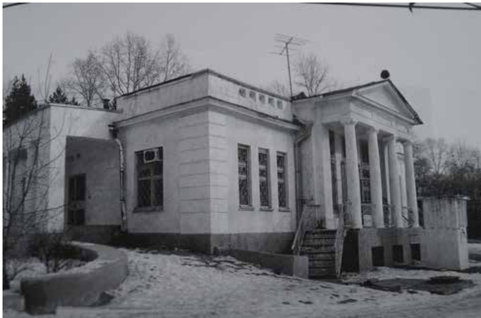
Фото 7. Летний дом в усадьбе купца Богданова.

Photo 7. Summer house in estate of merchant Bogdanov.