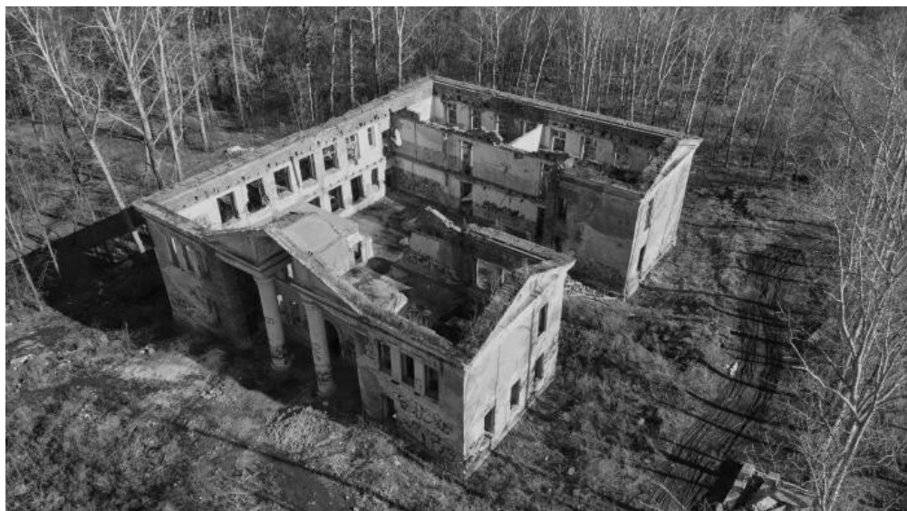
Фото 4. Усадьба купца Богданова.