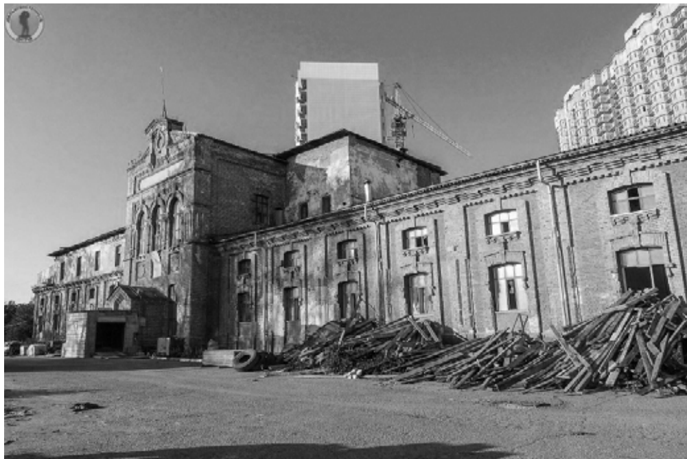
Фото 3. Спиртзавод купца Богданова.

Photo 3. Distillery of merchant Bogdanov.