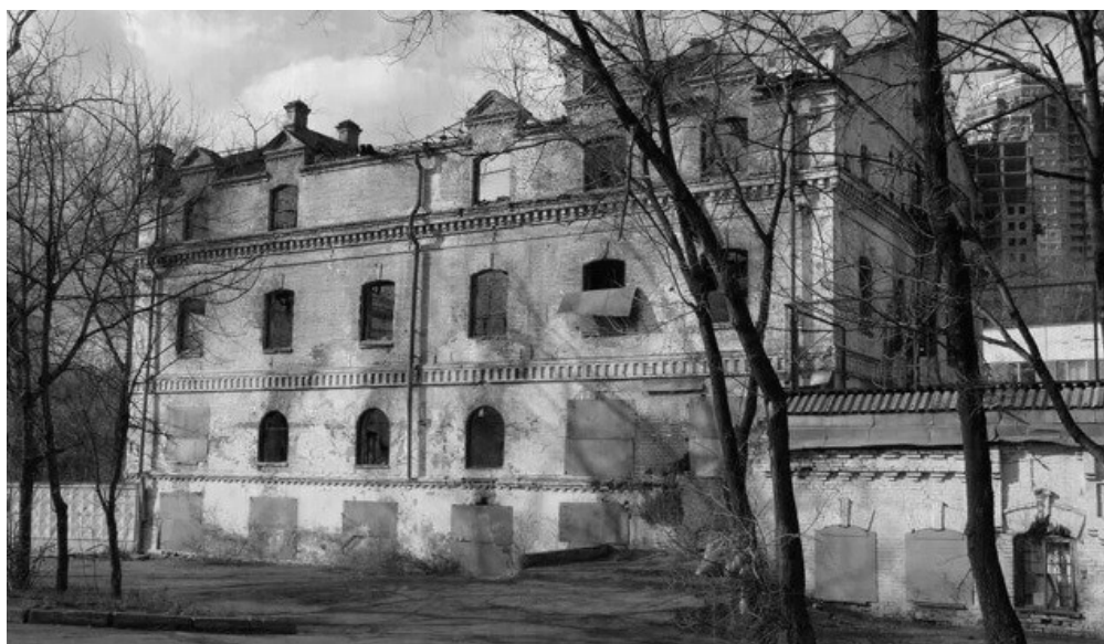
Фото 2. Мельница Н.И. Тифонтая.