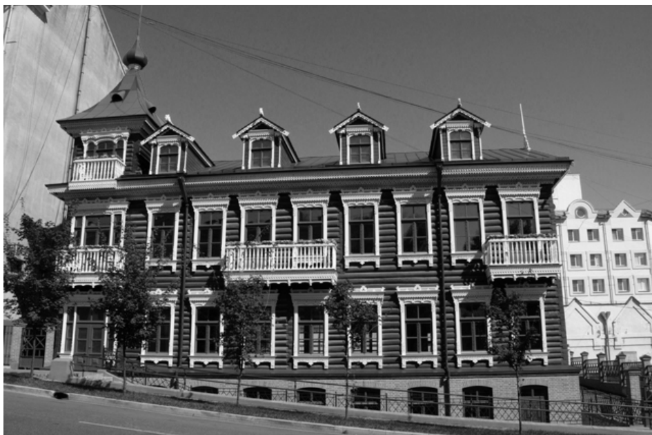
Фото 8. Доходный дом С.Д. Таболова и А.А. Битарова после реконструкции.