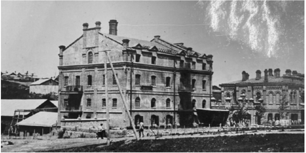
Фото 5. Мельница Н.И. Тифонтая.