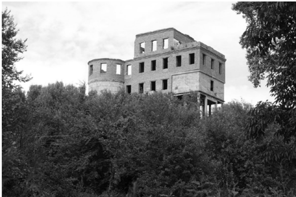
Фото 1. Башня Инфиделя.