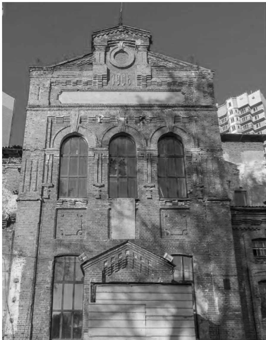
Фото 6. Входная группа спиртзавода купца Богданова.

Photo 6. Entrance group distillery of merchant Bogdanov.