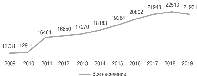
Рис. 1. Оценка численности населения городского округа Звенигород 1 , в чел., 2009–2019 гг. БДМО Росстата 2

В рассматриваемый период времени граница Звенигорода не менялась, поэтому вместе с численностью населения города росла и его плотность. По данным Росстата, за девять лет с 2009 г. по 2018 г. она увеличилась с 271 до 469 чел. на кв. км, т.е. почти в два раза.